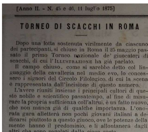
L'Illustrazione Universale dell'11 luglio 1875 (anno II, n. 45-46, pag. 367)

Secondo quanto riportato nel libro del torneo invece venne giocato “ nelle magnifiche sale del Circolo Filologico di Roma (Palazzo Del Drago) ” [6], immobile situato tra Via delle Quattro Fontane e la vecchia Via Pia (oggi Via del Quirinale) dove il 25 aprile 1875, giorno di apertura del Torneo, “ tutti i concorrenti (meno il Cav. D’Aumiller atteso per il 6 Maggio) insieme ai soci di Roma si trovarono riuniti ”.